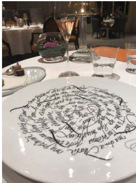
Lettres écrites par les maîtresses de Napoléon