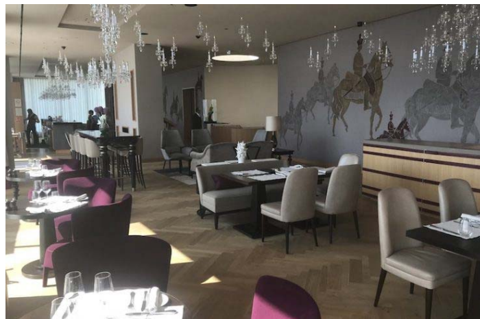
Des bulles en veux-tu en voilà !

On peut préférer dedans si le temps fait grise mine. Ici l'intérieur vaut l'extérieur, la vue est partout. Tables laquées noires, fauteuils vermillon font concurrence au millier de pampilles en cristal au plafond et une fresque signée Cécile Gauneau nous rappelle le régiment Royal-Champagne, des armées royales sous l' Ancien Régime .